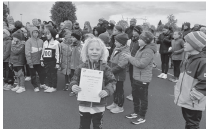
Biathlonstaffel im Burgstadion Undingen