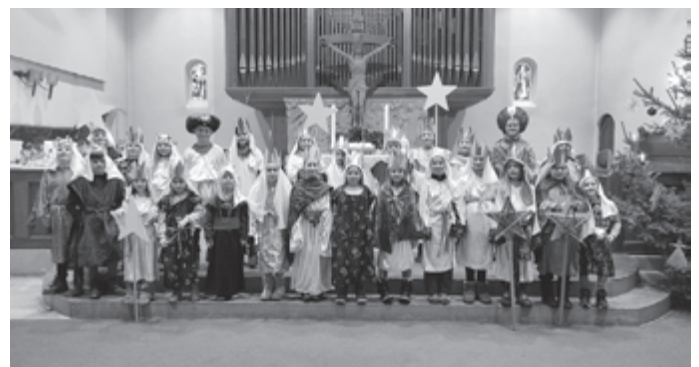
26 motivierte Sternsinger, bereit, sich auf den Weg zu den Häusern zu machen!